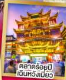
ตลาดร้อยปี เงินหวังเมียว