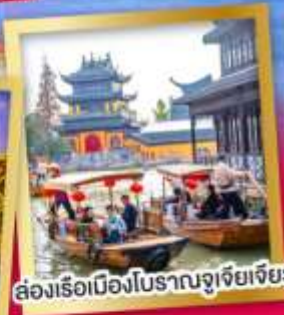
ล่องเรือเมืองโบราณซูโจวเจียว