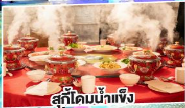
สุกี้ไต้มน้ำแข็ง