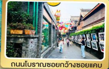
ถนนโบราณชอยกวางชอยแคบ