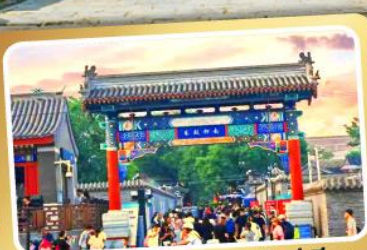
ถนนโบราณหนานหลิวกู่เซียง