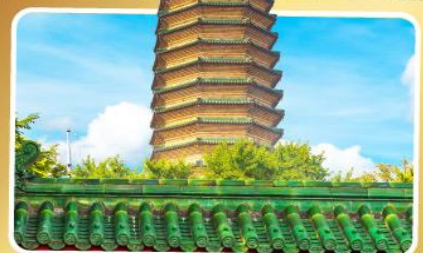
วัดพระเจี๋ยวแก้ว

เมนูพิเศษ เปิดปักกิ่ง, ชาหมูหม้อไฟ อาหารกวางตุ้ง, อาหารเสฉวน