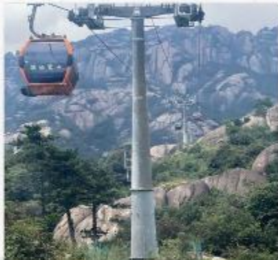
เขาลิ่งซาน