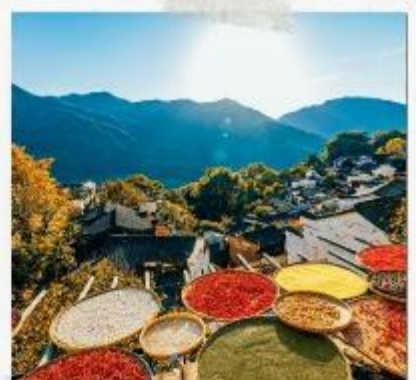
หมู่บ้านหวงลิ่ง