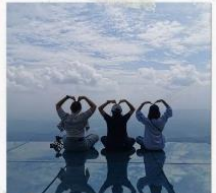
กระจกแห่งท้องฟ้า