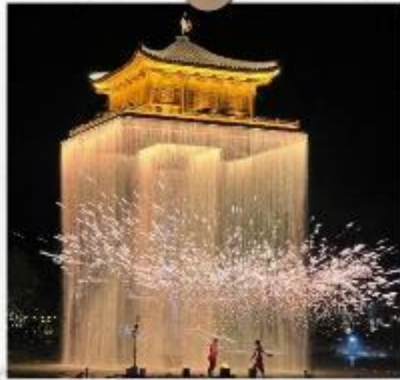
แสงไฟอุ๋นวิโจว