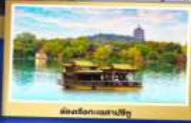
เมืองริ่งกวงเซาเป่ย์