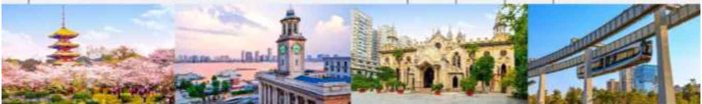
สวนชาทุระทะเลสาบโมซานตงหู