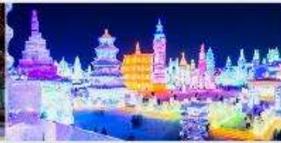
เทศกาลโคมไฟน้ำแข็ง