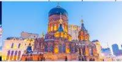
โบสถ์เซนต์โซเฟีย