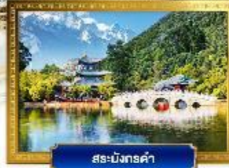
สระมังกรดำ