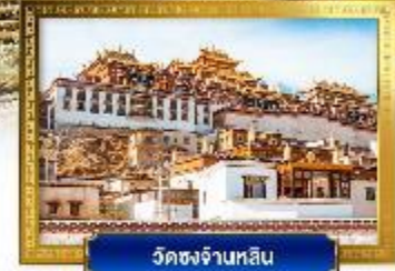
วัดชงจันหลิน