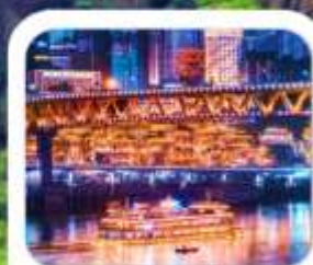
"ล่องเรือชมฉงชิ่ง"