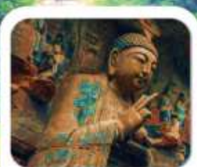
"มรดกโลกผาหินแกะสลักต้าจู้"