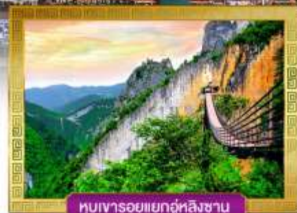
หุบเขารอยแยกอู่หลิงซาน