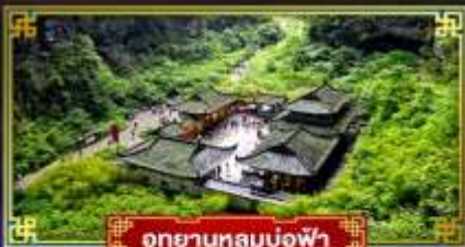
อุทยานหลุมฟ้า

"ฉงชิ่ง" มหานครสุดอลัง เมืองมรดกโลก อุทยานแห่งชาติหลุมฟ้า 3 สะพานสวรรค์