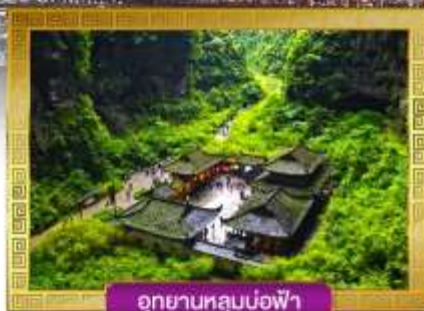
อุทยานหลุมบ่อฟ้า