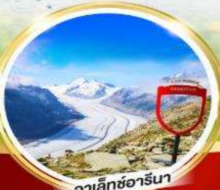
อาเล็กซารีนา