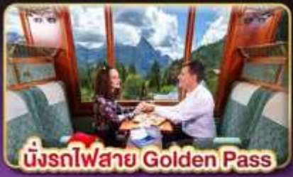
นั่งรถไฟสาย Golden Pass