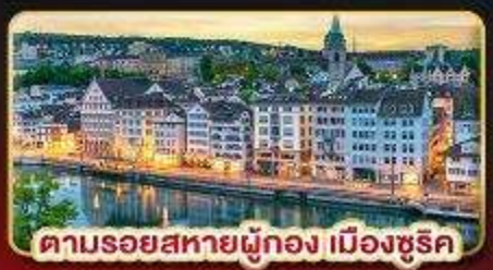
ตามรอยสหายผู้กอง เมืองซูริค