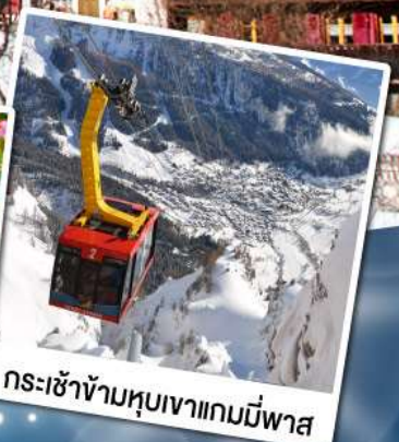
กระเช้าข้ามหุบเขาแกมมีพาส