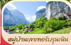
หมู่บ้านเลาเทอร์บรุนเนิน