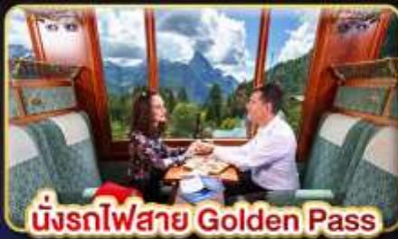
นั่งรถไฟสาย Golden Pass