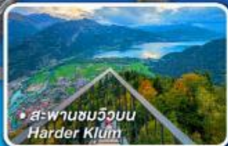
• สะพานขมวุ้น Harder Klamm