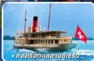
• สองเรือทะเลสาบลูเซิร์น