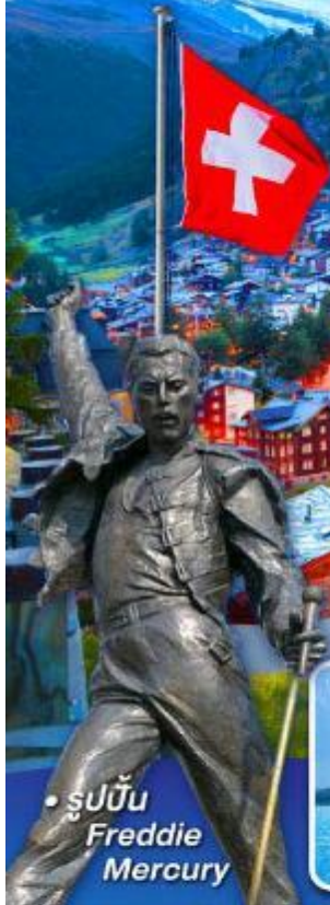
• รูปปั้น Freddie Mercury

พีชิต 5 เวก์ทิ, เวก์ฮาร์เตอร์คุม, เวก์จงเฟรธา เวก์กลาเซียร์ 3000 และ เวก์กรอนเนอร์แกรท