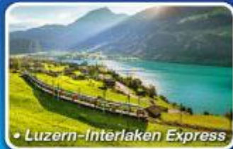
• Luzern-Interlaken Express