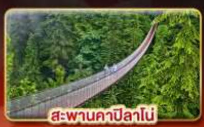
สะพานคาปิลานี

“ชมใบไม้เปลี่ยนสี” ส่องเรือน้ำตกในแองการ่า