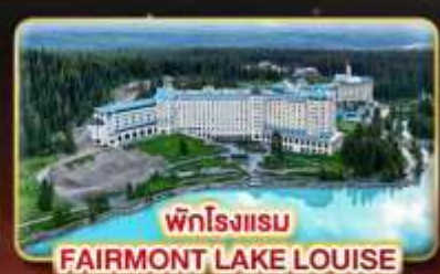
พักโรงแรม FAIRMONT LAKE LOUISE