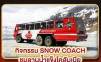
กิจกรรม SNOW COACH ชมลานน้ำแข็งโคลิมเบีย