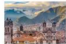
ย่านเมืองเก่าคุซโก

** พักที่ San Agustin La Recoleta Hotel 4* หรือเทียบเท่า **