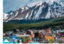
เมืองเอลคาลาฟาเต

** พักที่ Xelena Hotel 4* หรือเทียบเท่า **