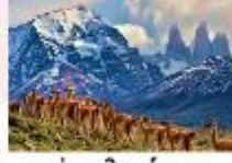
อุทยานแห่งชาติตอร์เรส เดล เพน