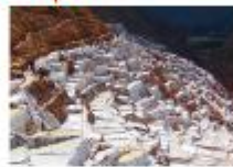
เหมืองเกลือโบราณ