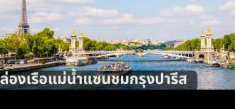
ล่องเรือแม่น้ำแซนชมกรุงปารีส