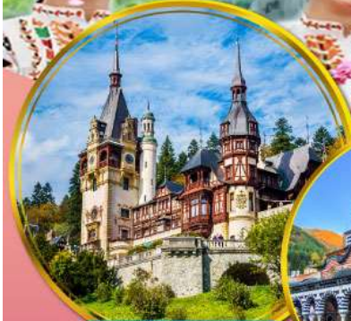
ปราสาทเปเลส