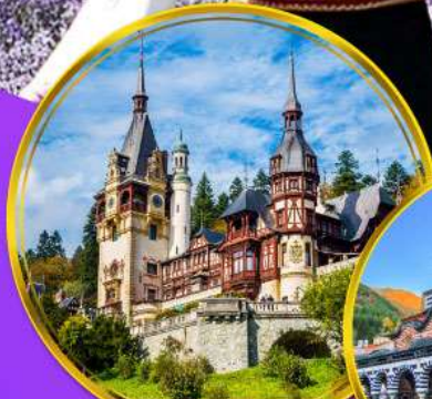
ปราสาทเปเลส