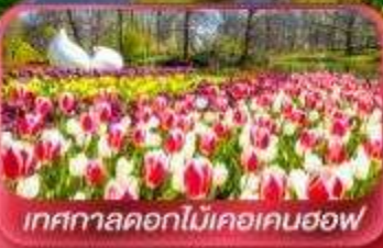
เทศกาลดอกไม้เคเคนฮอฟ