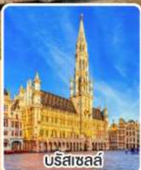
บริสเซลล์

พิเศษ!! เมนู หอยแอสคาโต้, จากหมู่บ้านเยอรมัน หอยแมลงภู่อบไวน์ขาว