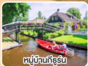
หมู่บ้านทึร์น