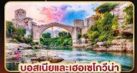
บอสเนียและเฮอร์เซโกวีนา