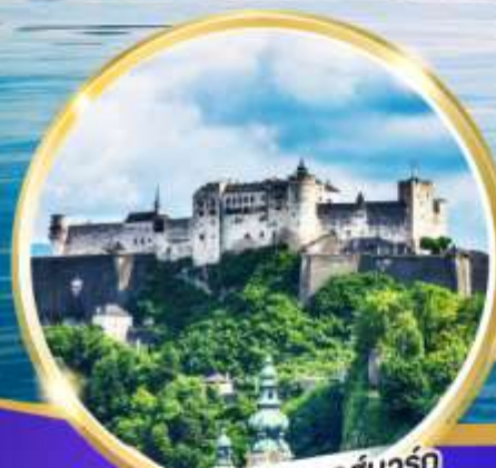
ปราสาทไฮเซนซาลส์บวร์ก