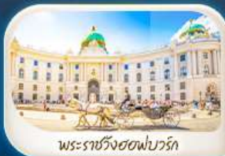
พระราชวังฮอฟบวร์ก

12-18 มี.ค.68 / 19-25 มี.ค.68 28 เม.ย. - 4 พ.ค.68 7-13 พ.ค.68