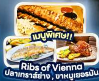
เมนูพิเศษ!! Ribs of Vienna ปลาเทราสย่าง, บาหมูเยอรมัน