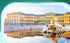
พระราชวังเชินบรุนน์