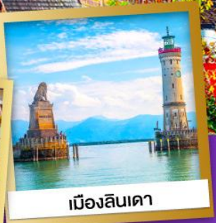
เมืองลินเดา