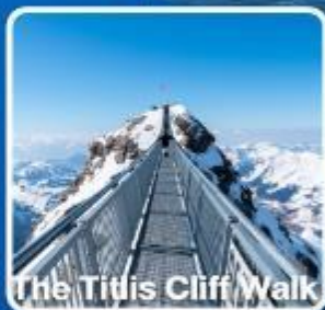
The Titlis Cliff Walk