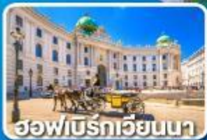
ฮอฟเบียร์เวียนนา