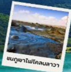
ชมภูเขาไฟโคลนลาวา